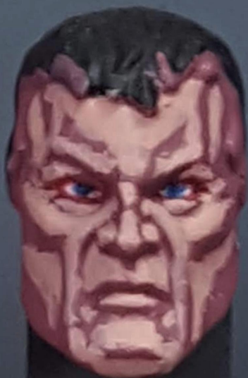
Previous step Paso previo