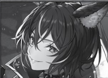
Eighth World: Malebolge the Chaotic

A beast with an abyssal depth of 13, the strongest in history. Seeks to annihilate the entire human race.