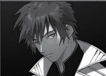
Ninth World: Empire, Soul of the Samurai

Appeared in the imperial capital through means beyond reason. Plotting ways for the Seekers to be their own undoing.