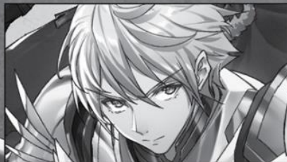
Leon Fredric (Knight)

A former gladiator from the lands of the far east. A front-liner skilled with the blade.