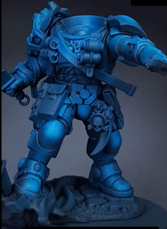
Contrast Frostheart Blue