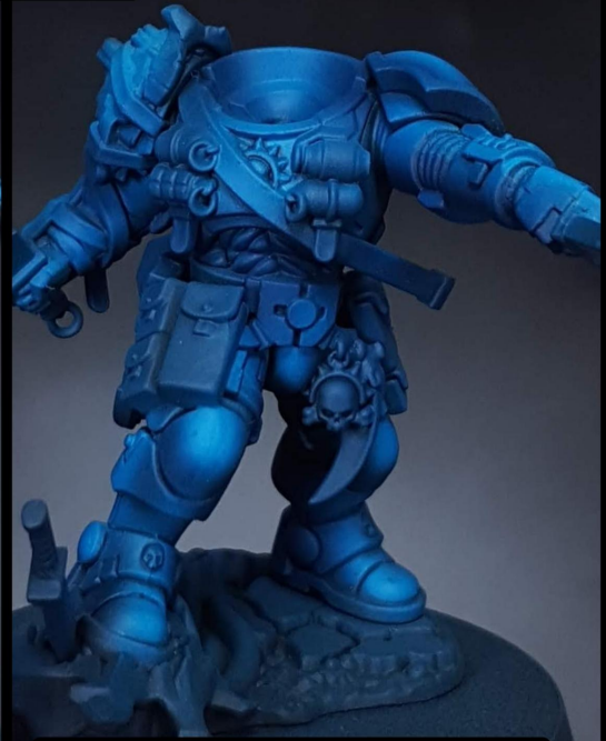
Contrast Talassar blue (aiming the shadows/ apuntando a las sombras)