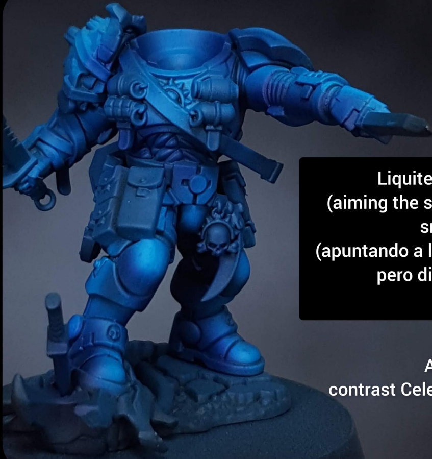
Liquitex Ftalo blue (aiming the shadows but smaller shot) (apuntando a las sombras pero disparos mas pequeños)